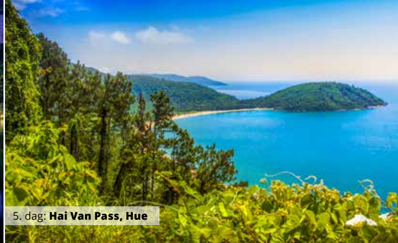
5. dag: Hai Van Pass, Hue