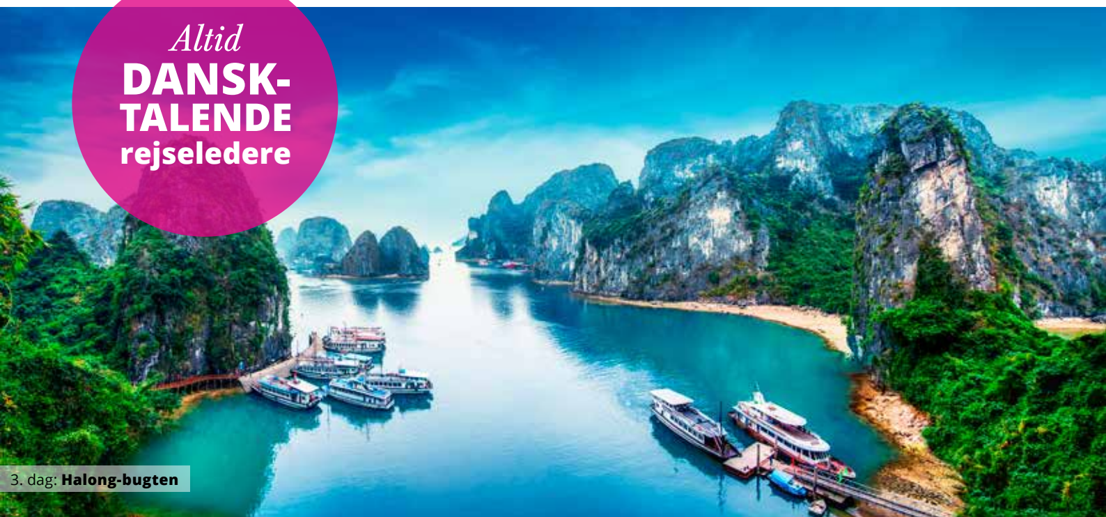
3. dag: Halong-bugten