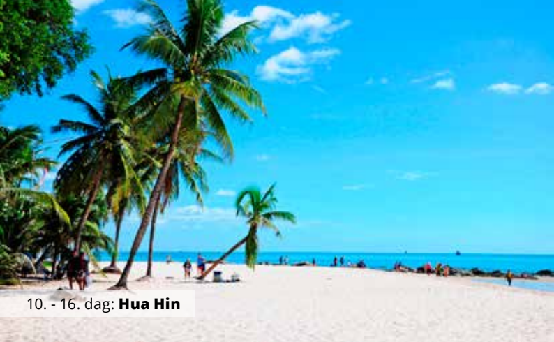
10. - 16. dag: Hua Hin