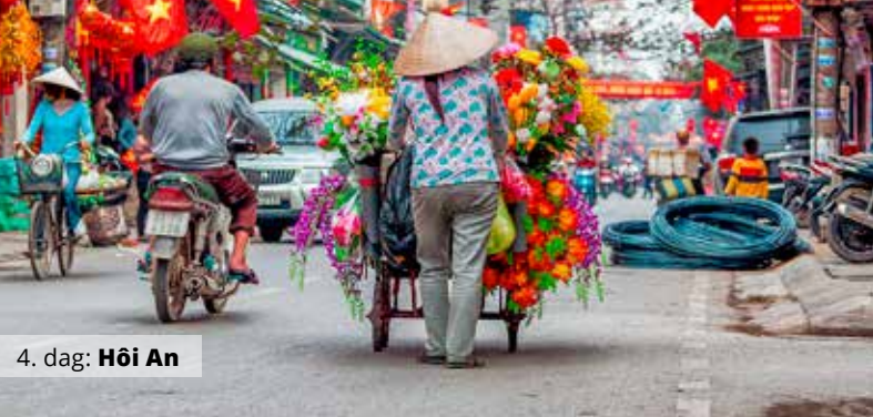
4. dag: Hôi An