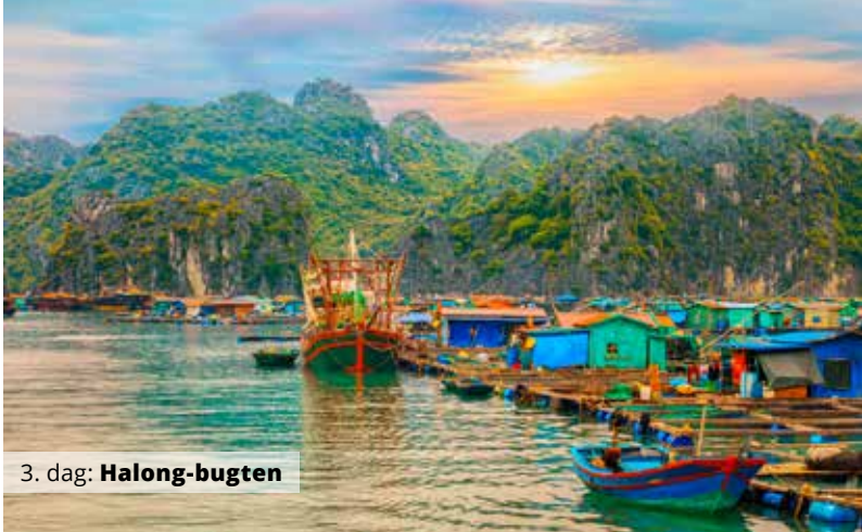
3. dag: Halong-bugten

Bravo Tours har et bredt udvalg af rundrejser til mange steder i verden