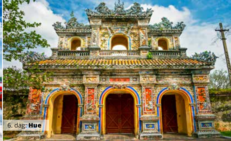
6. dag: Hue

Vietnam har en magisk side – den verdensberømte Halong-bugt! Vi kører afsted gennem smukke landskaber og ankommer til Halong-bugten med sit fantastiske smaragd-grønne vand og de tusindvis af flotte og frodige kalkstensøer – et mystisk og fascinerende landskab, der er på UNESCOs verdensarvsliste. Vi sejler med vores egen kinesiske junker på bugten, med de skjulte grotter helt tæt på – ingen Vietnamrejse er fuldstændt uden denne tur! Til middag smager vi naturligvis på den friske mad og seafood. Vi overnatter om bord på båden i flotte kahytter.