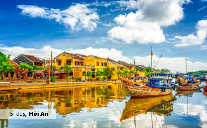
5. dag: Hôi An