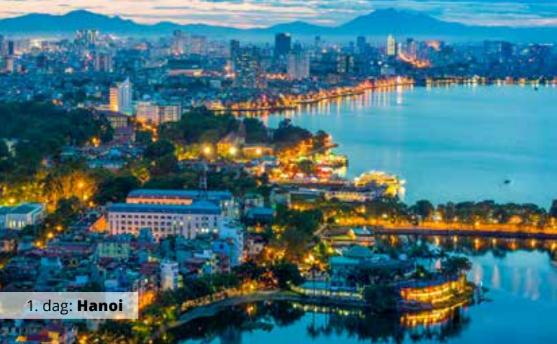
1. dag: Hanoi