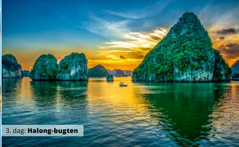
3. dag: Halong-bugten