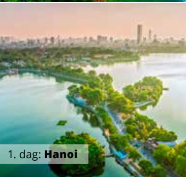
1. dag: Hanoi