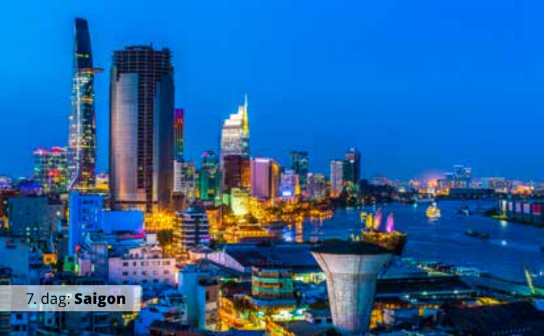
7. dag: Saigon