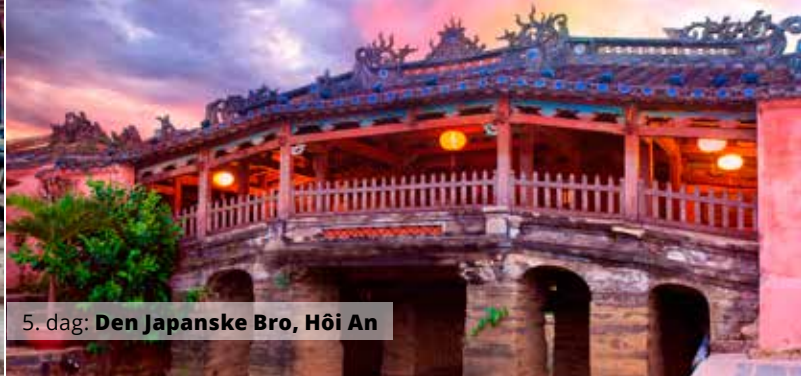
5. dag: Den Japanske Bro, Hôi An