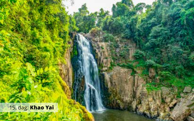
15. dag: Khao Yai