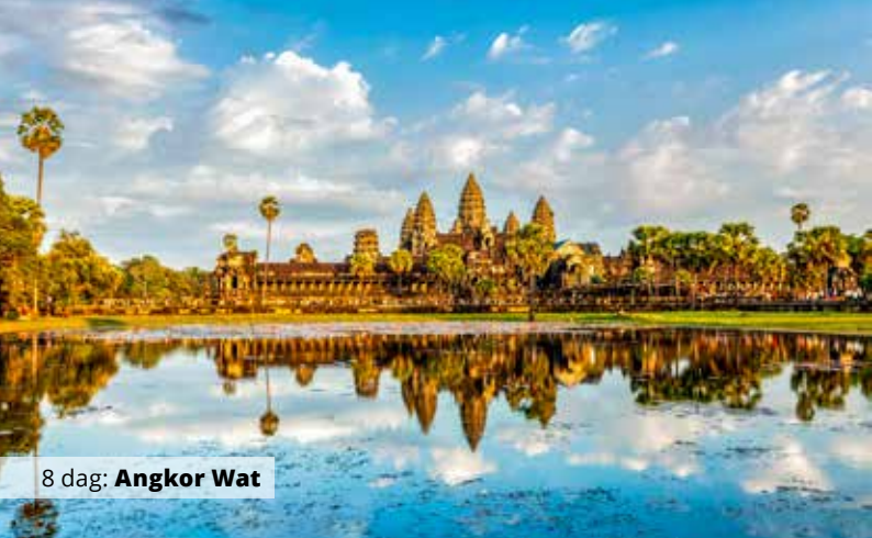
8 dag: Angkor Wat