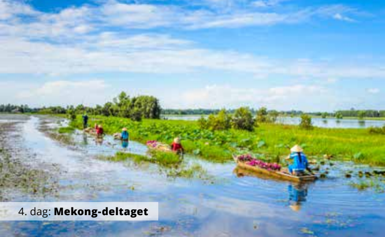
4. dag: Mekong-deltaet