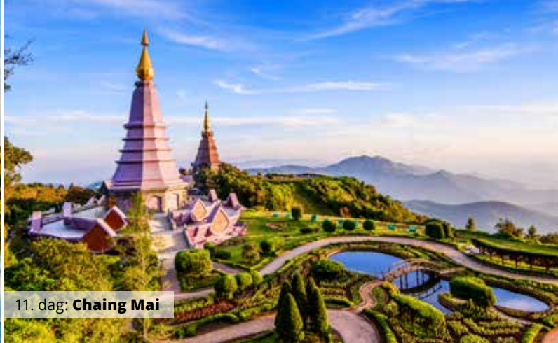
11. dag: Chiang Mai

kitektonisk højdepunkt i den klassiske khmerkultur, og det er verdens største tempel. Det er et symbol for hele landet og ses bl.a. på nationalflaget. Templet er ikke mindre end imponerende og kan sammenlignes med pyramiderne i Egypten, hvor man her heller ikke er enige om byggemetoden.