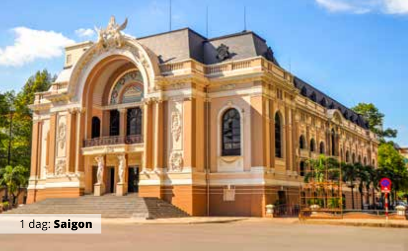
1 dag: Saigon