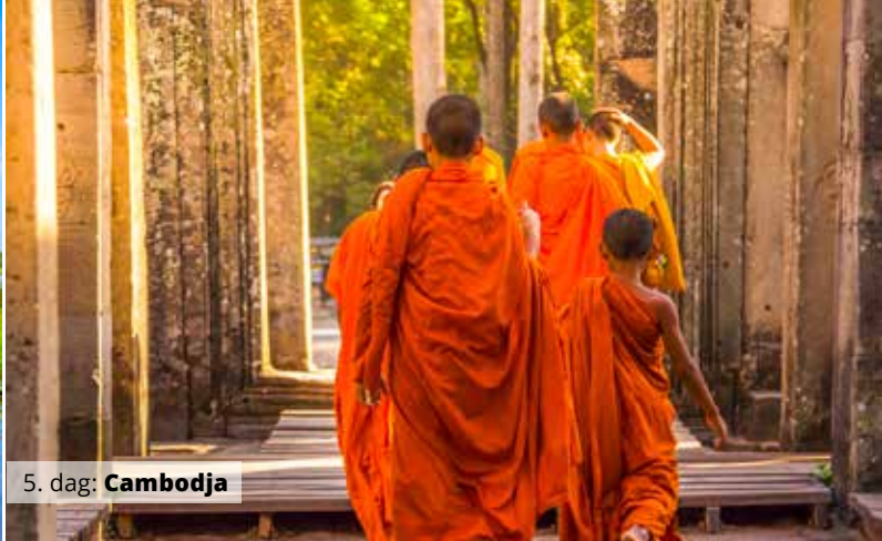
5. dag: Cambodja

Resten af aftenen er til fri disposition. Vi overnatter på hotellet i Saigon.