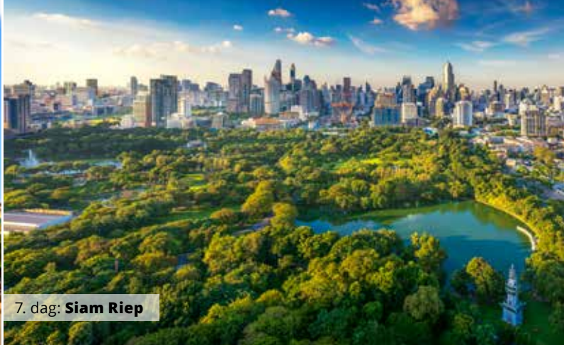
7. dag: Siam Riep