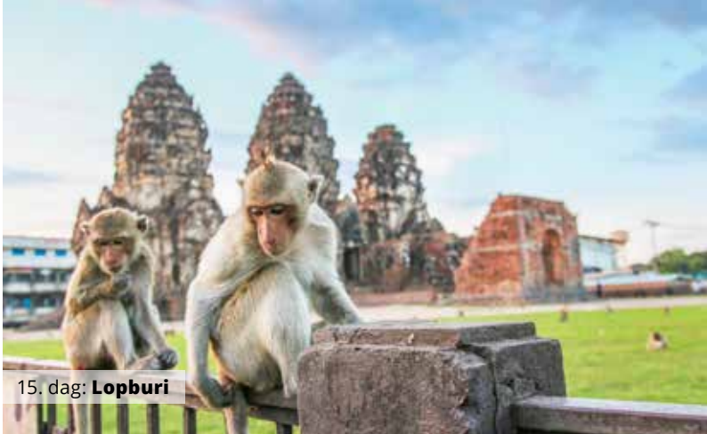
15. dag: Lopburi

Bravo Tours har et bredt udvalg af rundrejser til mange steder i verden