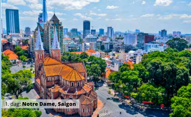
1. dag: Notre Dame, Saigon

er en af Danmarks mest erfarne rundrejseludere og kører i 2019 flere af Bravo Tours' spændende rundrejser i Østen. 40 års rejseledererfaring.