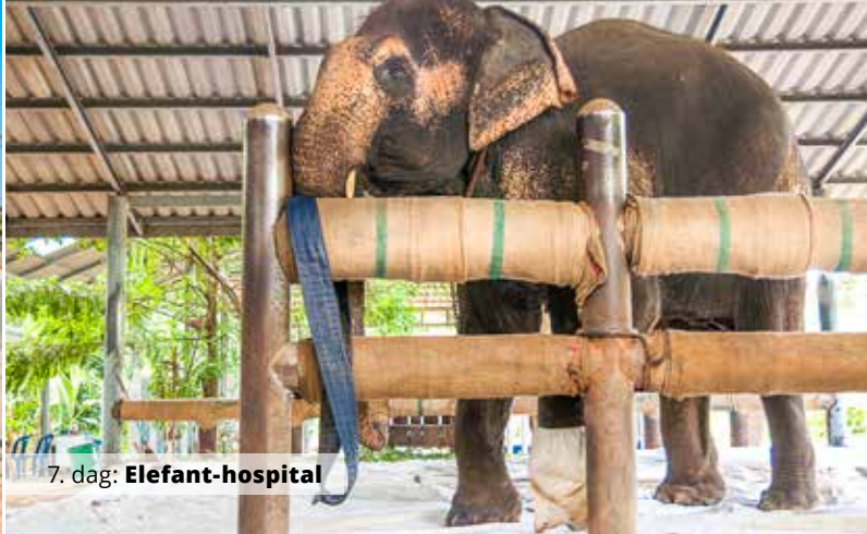
7. dag: Elefant-hospital

Når du bliver sulten, er der både mulighed for at besøge finere restauranter eller prøve det spændende thailandske gadekøkken. I kan nyde eftermiddagen og aften, som I har lyst. Vi overnatter i Mae Sariang-området.