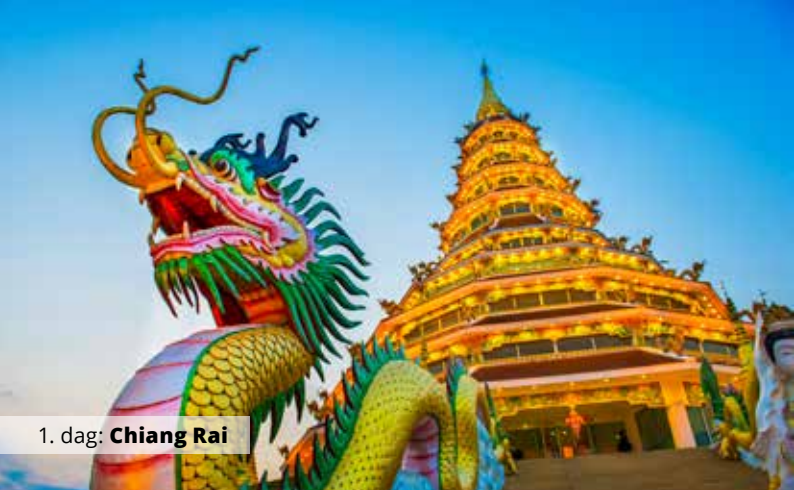
1. dag: Chiang Rai