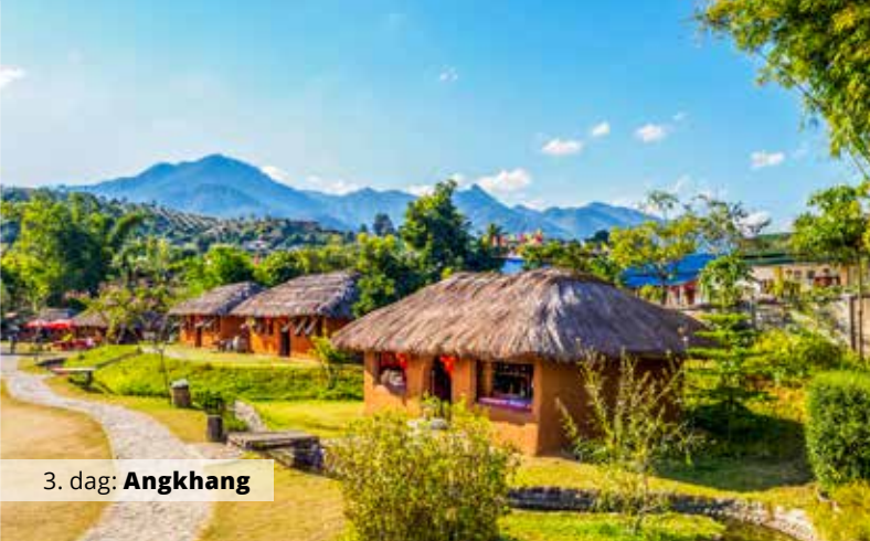
3. dag: Angkhang