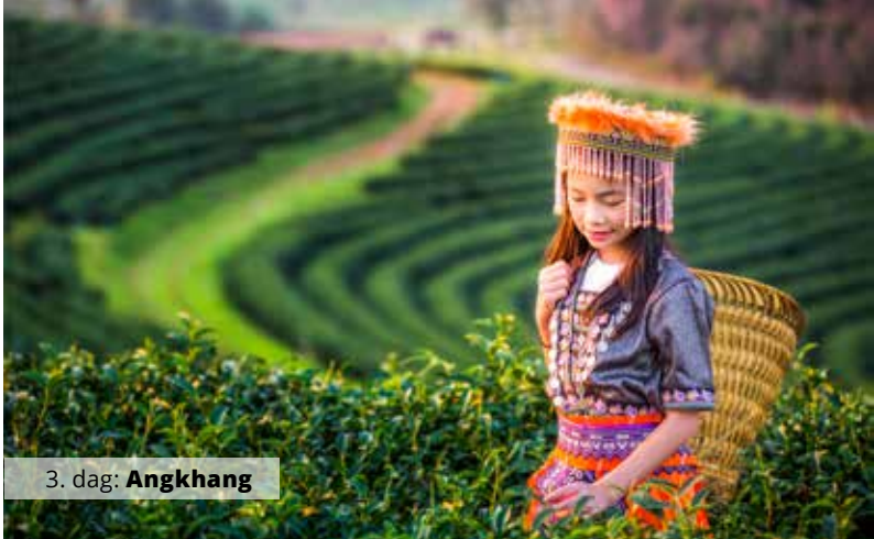
3. dag: Angkhang