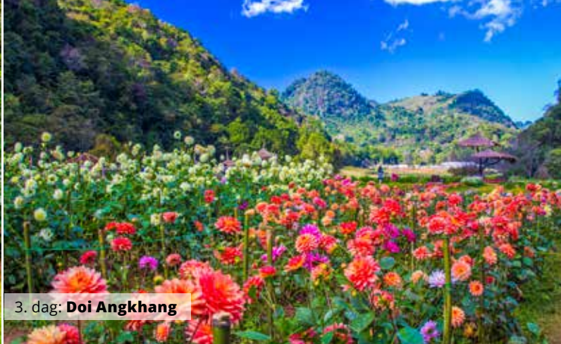
3. dag: Doi Angkhang