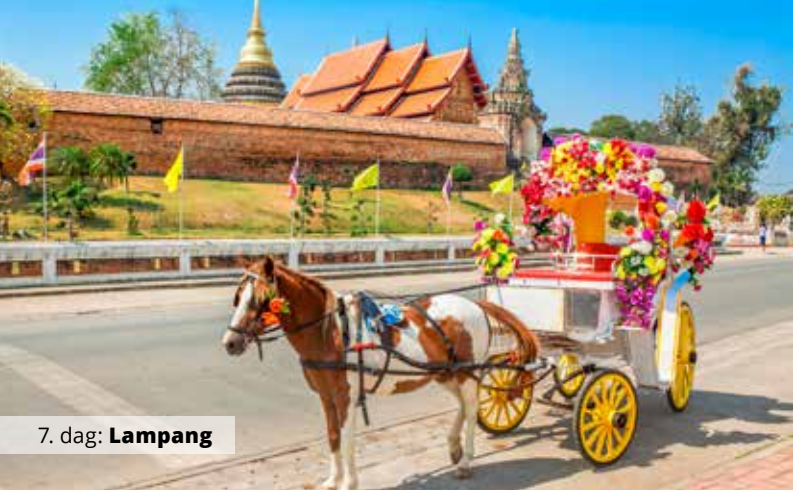
7. dag: Lampang