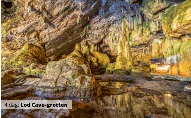
4 dag: Lod Cave-grotten

Bravo Tours har et bredt udvalg af rundrejser til mange steder i verden