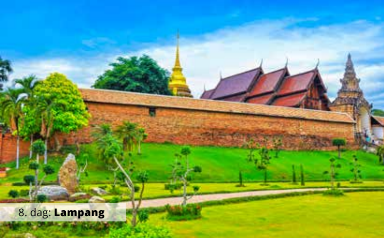
8. dag: Lampang