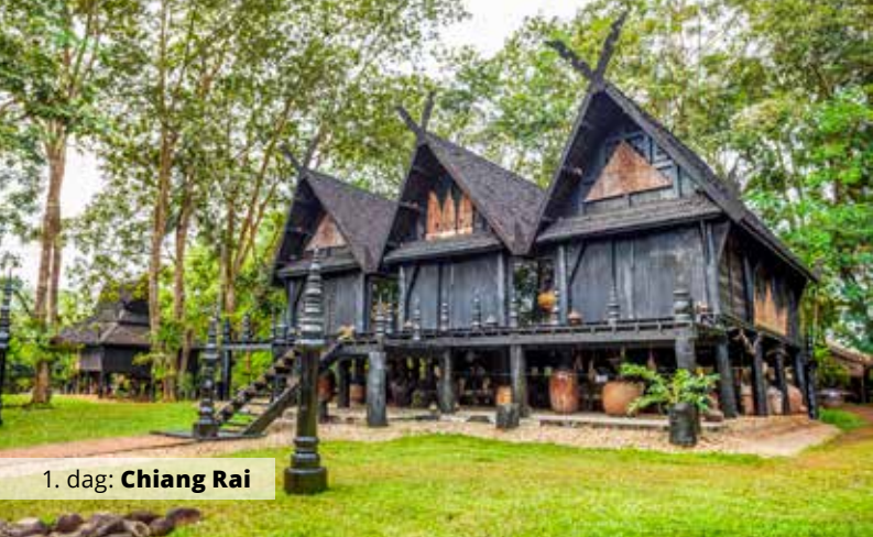
1. dag: Chiang Rai