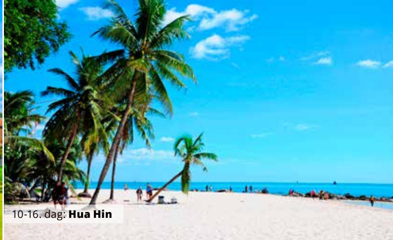
10-16. dag: Hua Hin