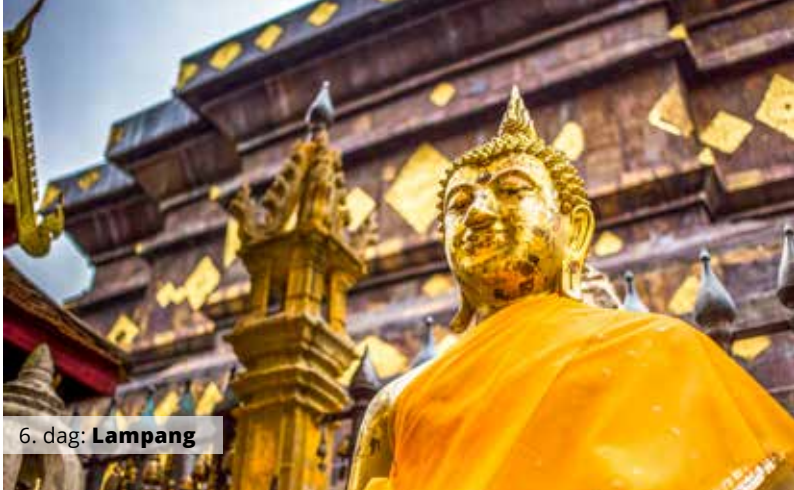
6. dag: Lampang