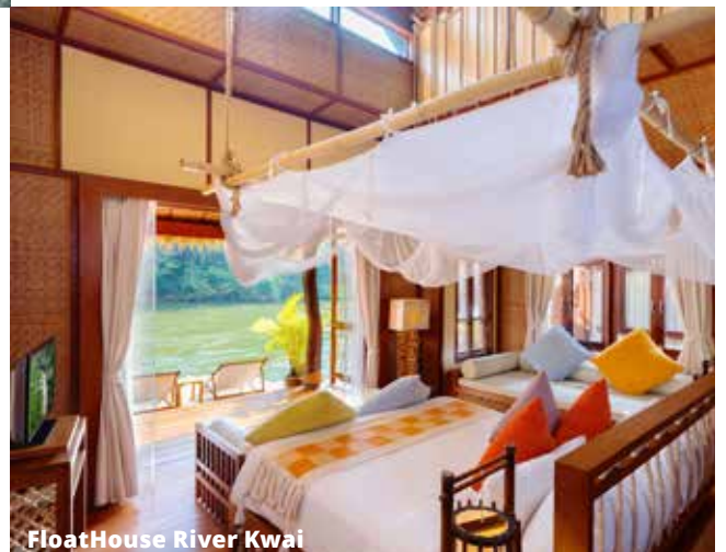
FloatHouse River Kwai