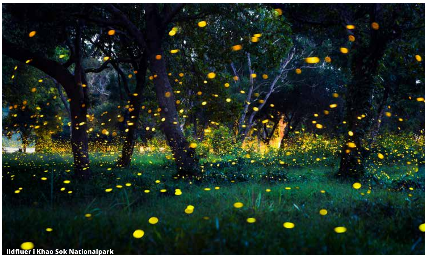
Ildfluer i Khao Sok Nationalpark

Vi ankommer til Danmark med masser af dejlige ferieoplevelser i bagagen.