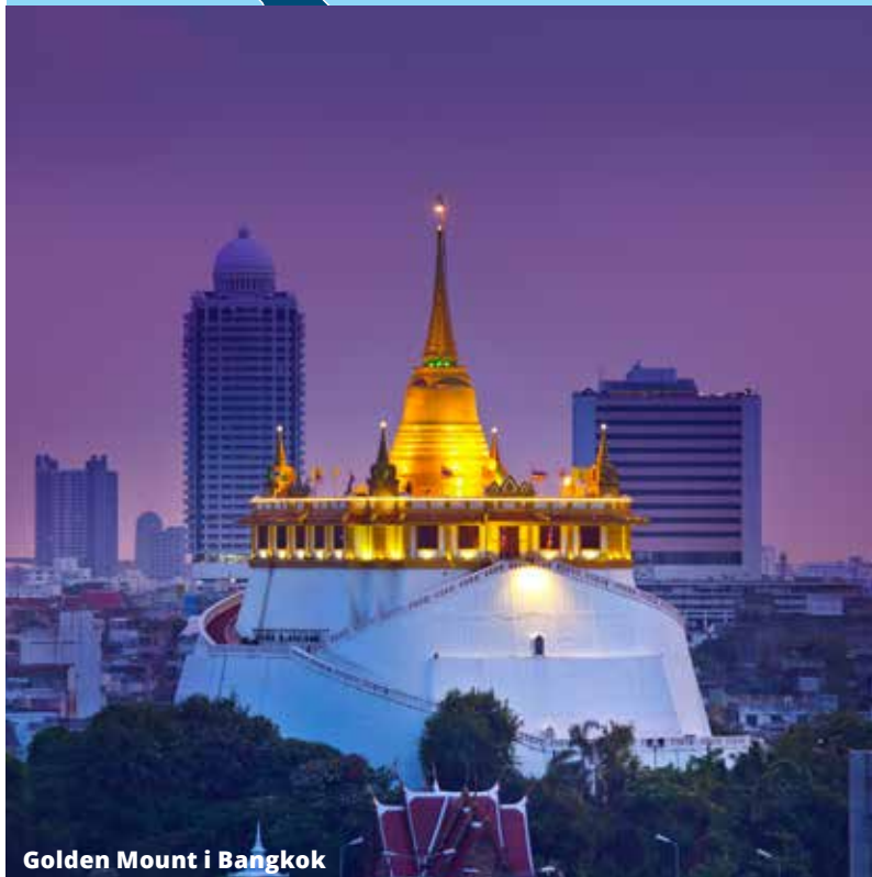
Golden Mount i Bangkok