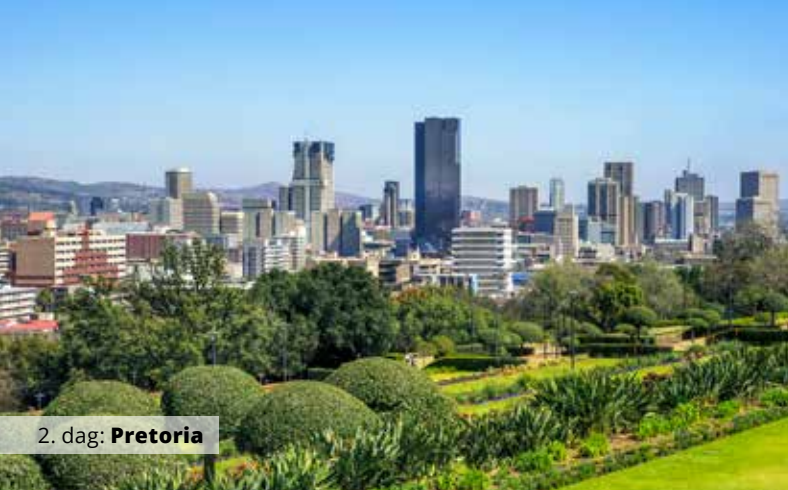
2. dag: Pretoria