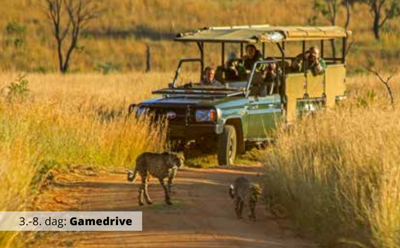
3.-8. dag: Gamedrive