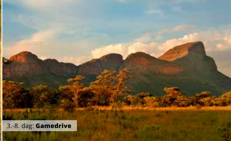
3.-8. dag: Gamedrive

Officielt blev 23 studerende dræbt, men de mere reelle tal ligger nok nærmere mellem 176-700.