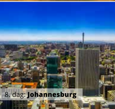
8. dag: Johannesburg