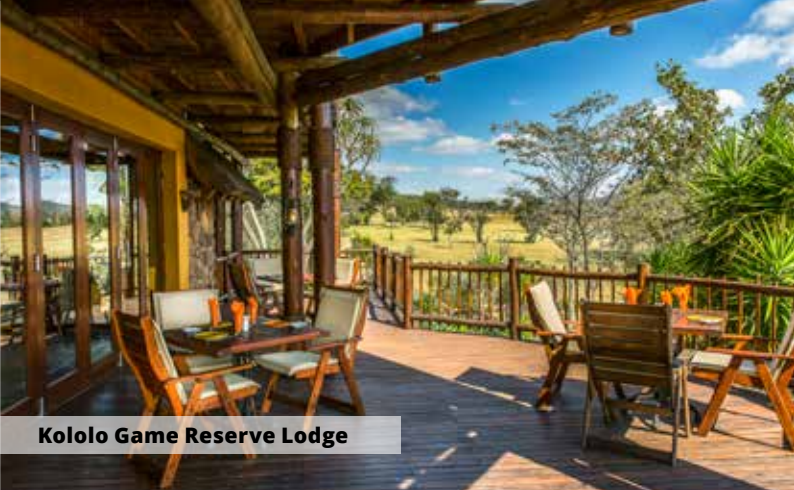
Kololo Game Reserve Lodge