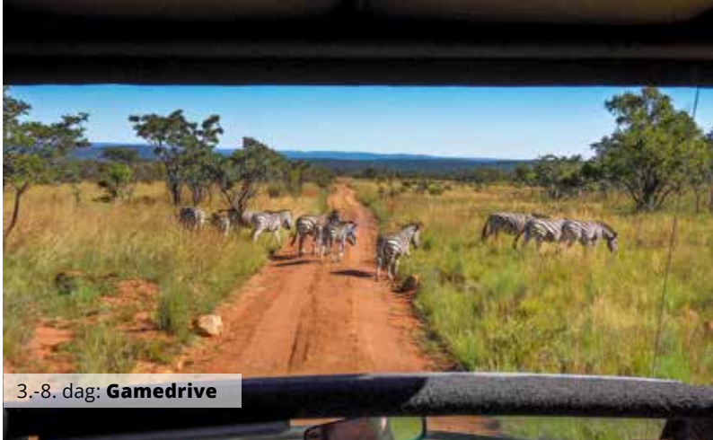
3.-8. dag: Gamedrive

Dagen byder på 3 timers gamedrive blandt mere end 50 forskellige pattedyr – herunder Big 5. "The Big 5" referer til den afrikanske løve, elefant, bøffel, leopard og næsehorn. For mange er det disse dyr, der er indbegrebet af safari. De er i sin tid blevet til "The Big 5", fordi de eftersigende er de sværeste og farligste at jage.