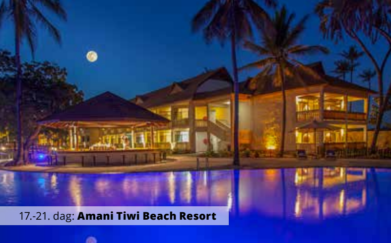
17.-21. dag: Amani Tiwi Beach Resort