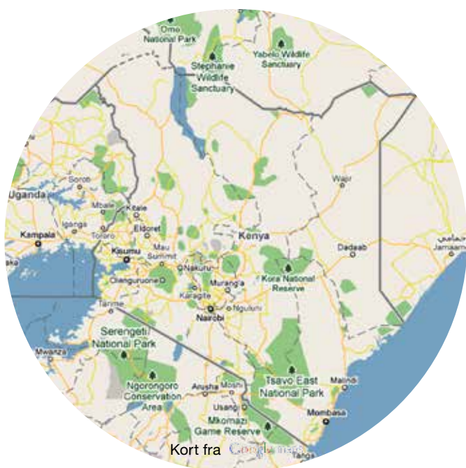
Kort fra Google Maps