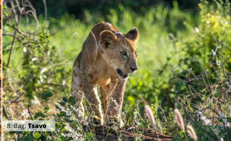
8. dag: Tsavo

vi, at personalet gør alt for, at vores ophold bliver perfekt. Den ene dag er der middag i hovedrestauranten, den næste spiser vi måske under palmerne på stranden eller langs poolkanten. Serviceniveauet er i top!