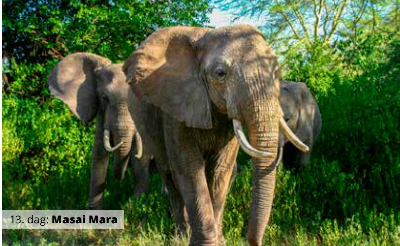
13. dag: Masai Mara