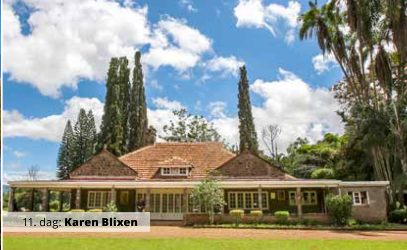
11. dag: Karen Blixen

(med rød jord på sig), men her er også giraffer, gazeller og de store kattedyr. Der er altså næsten garanti for allerede første dag at se masser af dyr.