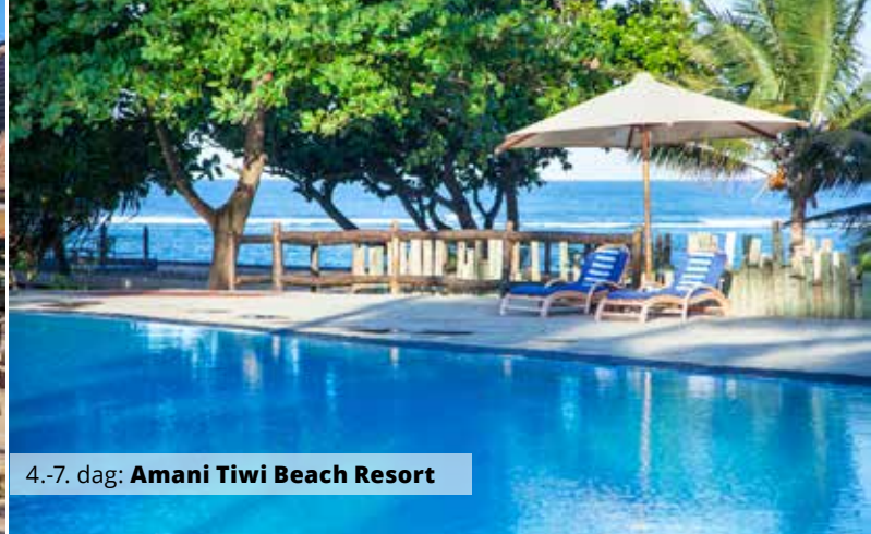
4.-7. dag: Amani Tiwi Beach Resort

LANGTIDSFERIE PÅ KENYA-KYSTEN – MED 7 DAGES SAFARI