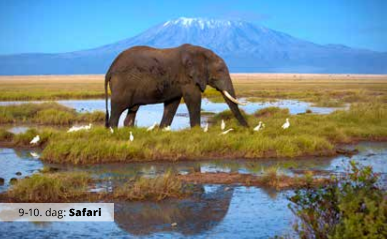
9-10. dag: Safari