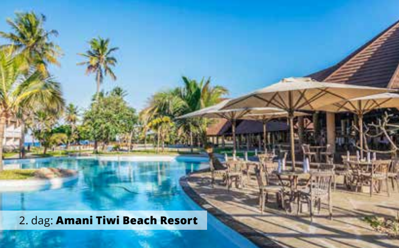
2. dag: Amani Tiwi Beach Resort