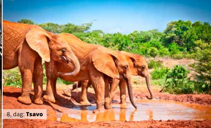
8. dag: Tsavo