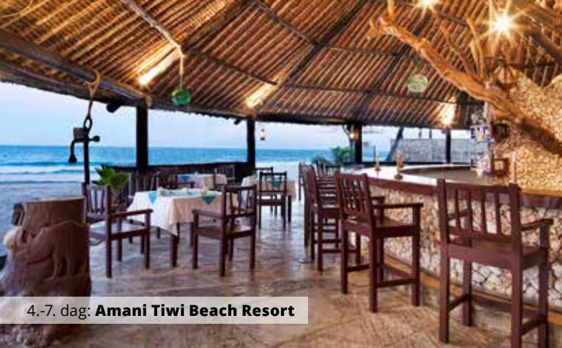
4.-7. dag: Amani Tiwi Beach Resort