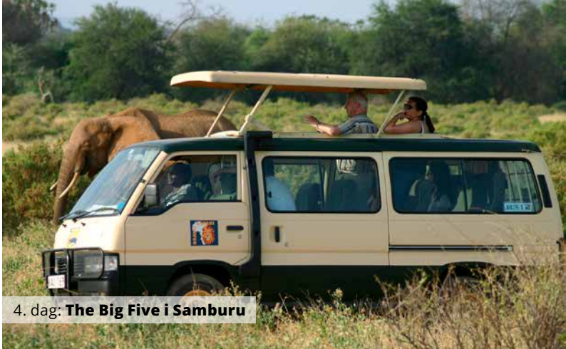
4. dag: The Big Five i Samburu