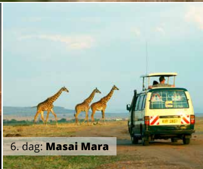
6. dag: Masai Mara