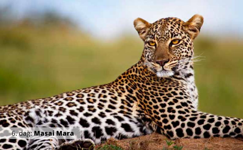
6. dag: Masai Mara