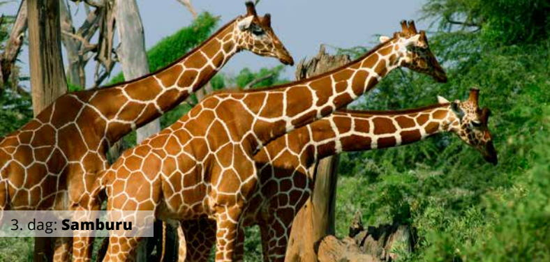
3. dag: Samburu