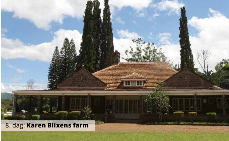
8. dag: Karen Blixens farm