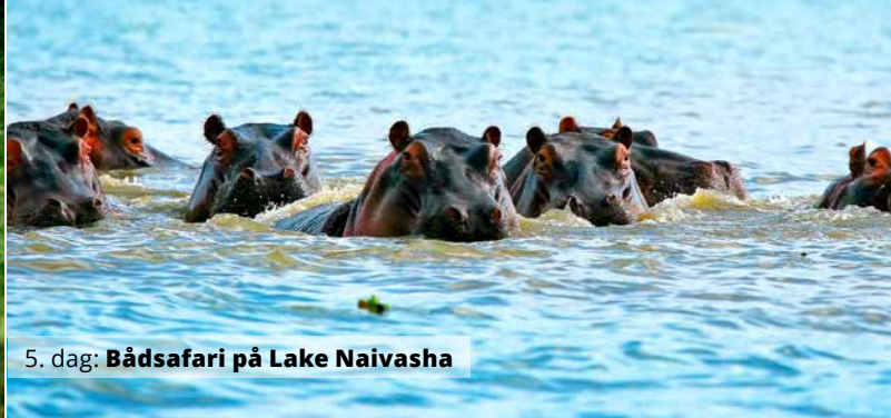
5. dag: Bådsafari på Lake Naivasha