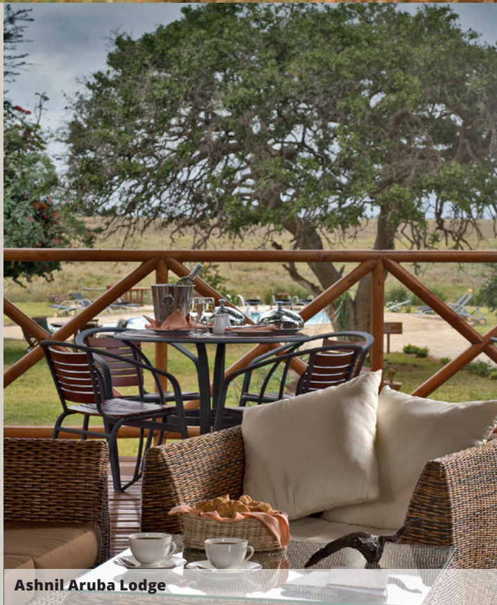
Ashnil Aruba Lodge