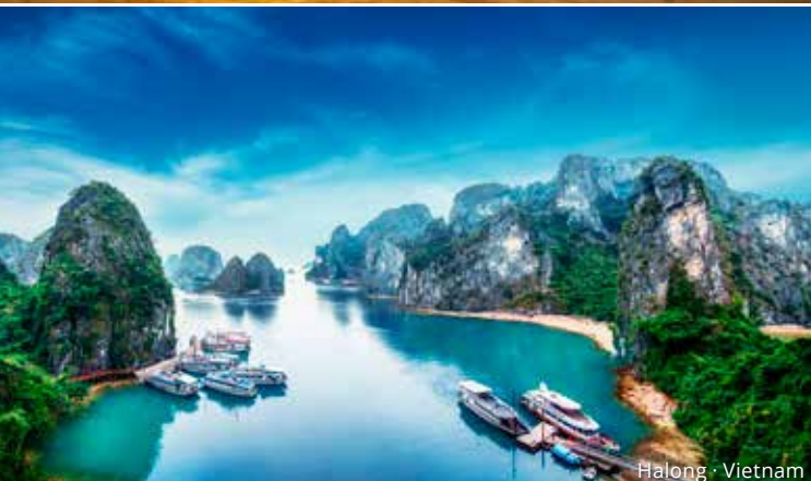
Halong · Vietnam