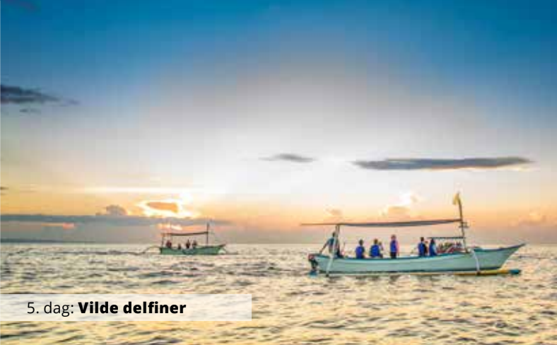
5. dag: Vilde delfiner