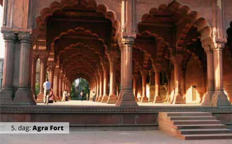
5. dag: Agra Fort