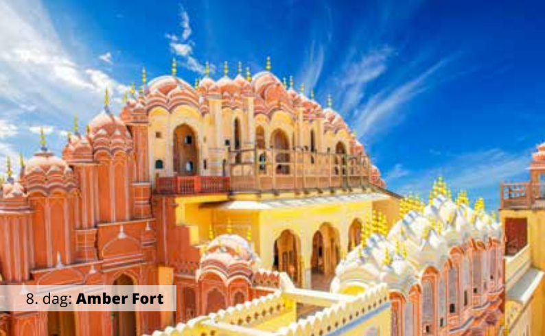
8. dag: Amber Fort