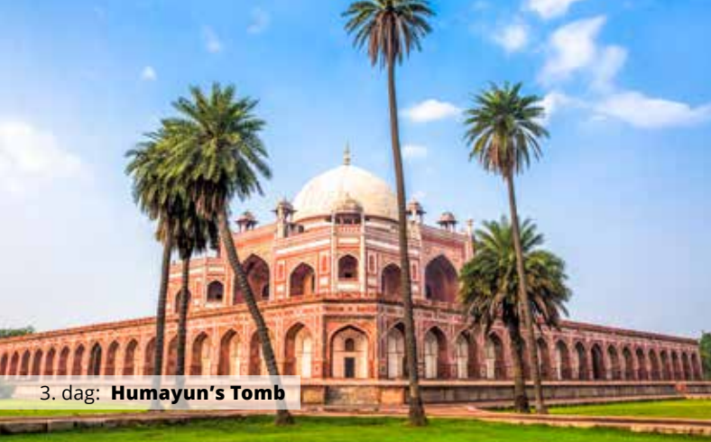
3. dag: Humayun's Tomb