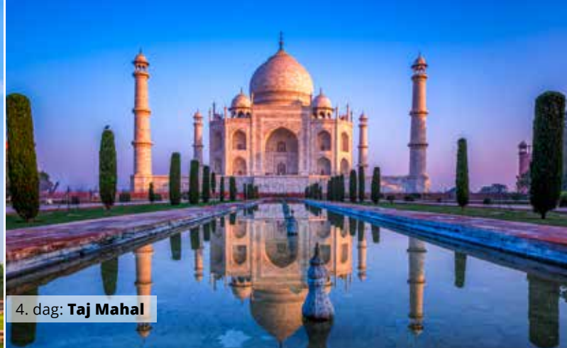
4. dag: Taj Mahal