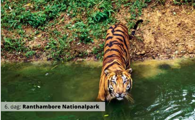
6. dag: Ranthambore Nationalpark