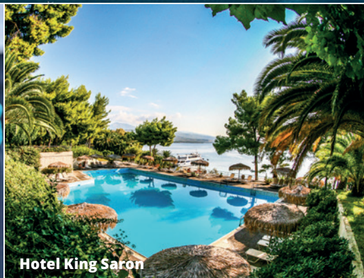
Hotel King Saron